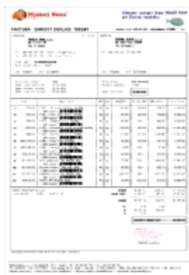
Faktura - daňový doklad [2]