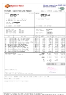
Faktura - daňový doklad

Tip: Pokud kliknete na vybraný obrázek, zobrazí se vám celý PDF dokumentu